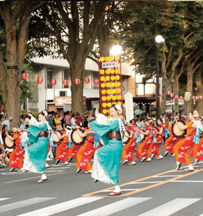
盛岡さんさ踊りでの出店