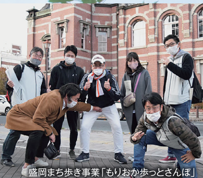
盛岡まち歩き事業「もりおか歩っとさんぽ」